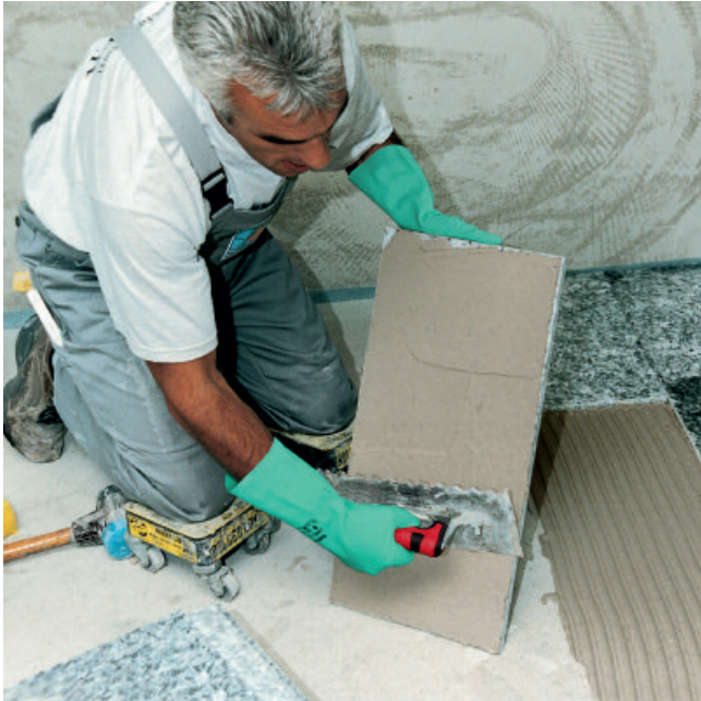
Zum hohlraumfreien Verlegen wird grundsätzlich eine Mörtelschicht auf die Plattenrückseite aufgetragen.